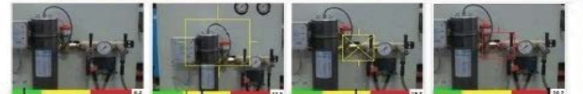
Delante de Fuga - Proximo a Fuga - Pequeña Fuga - Frente GRAN Fuga