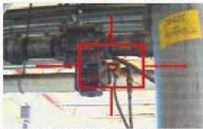
Nº2 51.5dB Gan.76 - 13/11/13 07 02 41 FOTO LOCALIZACION FUGA AIRE COMPRIMIDO www.gimateg.com