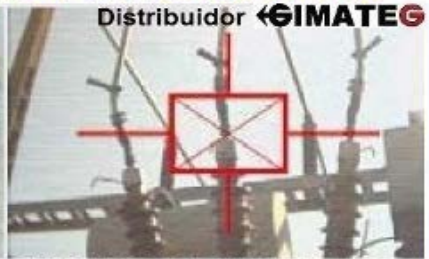
Nº18 14dB Gan.110 - 10/07/13 09 54 26 FOTO DE FENOMENOS ELECTRICOS HV como CORONA , ARCO , DESCARGAS PARCIALES