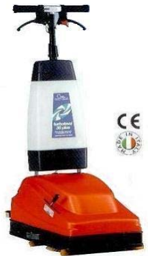
35 PLUS 19 kg.